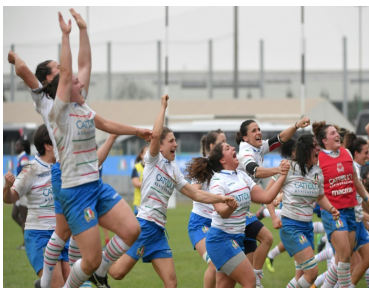
AFP Tiziana Fabi

L'Italie battant les Françaises avec un score de 31-12 ce dimanche à Padoue en finit avec le tournoi des six nations féminin. Grâce à ce succès, l'Italie termine 2 e au classement avec un total de 17 points devant les Françaises qui sont à la 3 e place avec 16 points. Samedi 16 Mars, l'Angleterre a remporté la première place en faisant le Grand Chelem en écrasant les Écossaises 80 à 0.